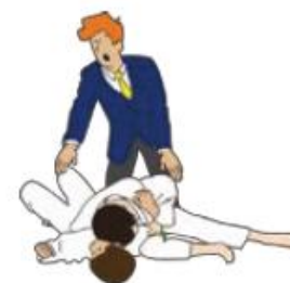
Sonomama ou Yoshi

Début d'Immobilisation Sortie d'immobilisation Interruption de l'immobilisation Reprise de l'immobilisation